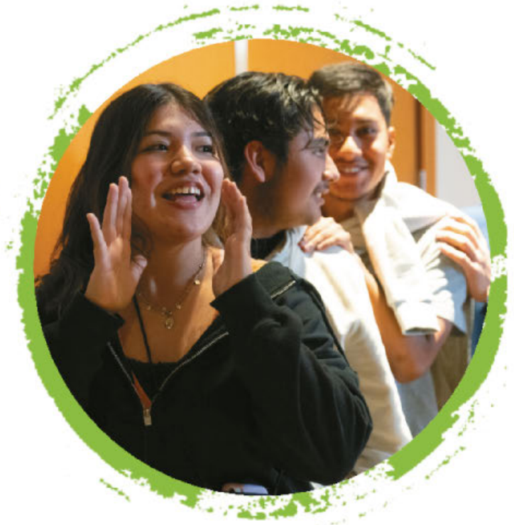
PICTURED: Catholic Youth Convention

“For we are all baptized by one Spirit so as to form one body.”